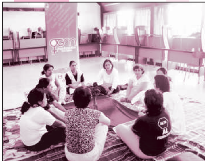
Jornada de capacitación para facilitadoras de Grupos de Autoayuda. Marzo 2007

8) Apoyo telefónico. Se brinda a todas las mujeres que solicitan orientación, asesoría y apoyo a su